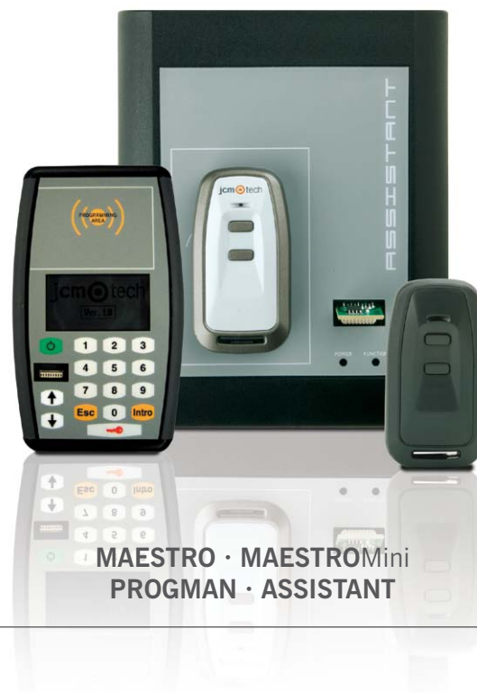
MAESTRO · MAESTROMini PROGMAN · ASSISTANT

jcm technologies prenez une longueur d'avance avec la technologie et imagination